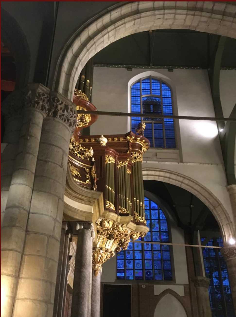
Het rijk versierde rugwerk