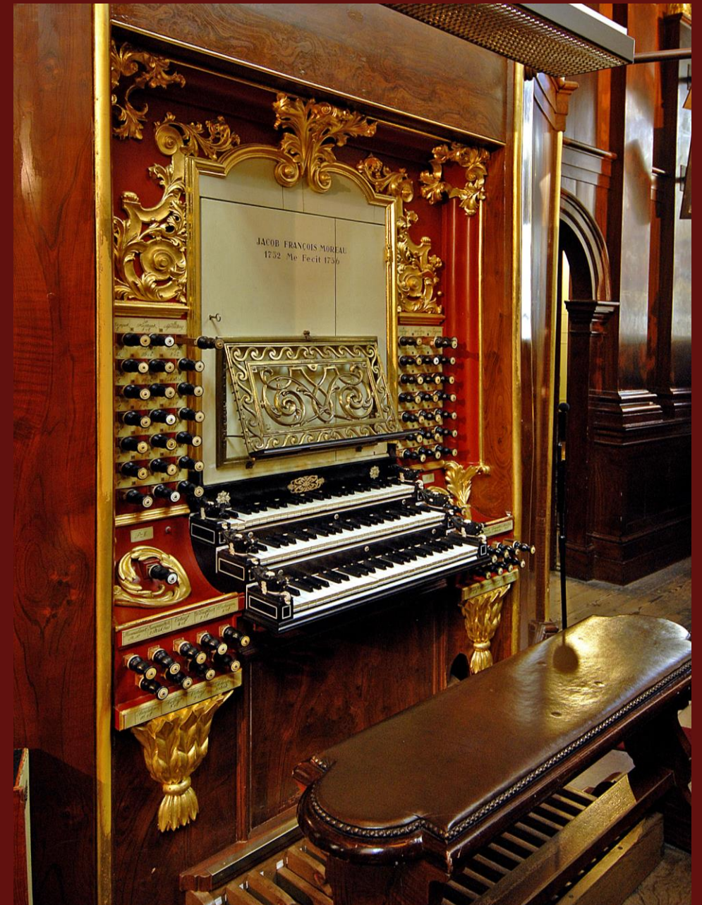
De prachtige klaviatuur

Koraalbewerking 'An Wasserflüssen Babylon'