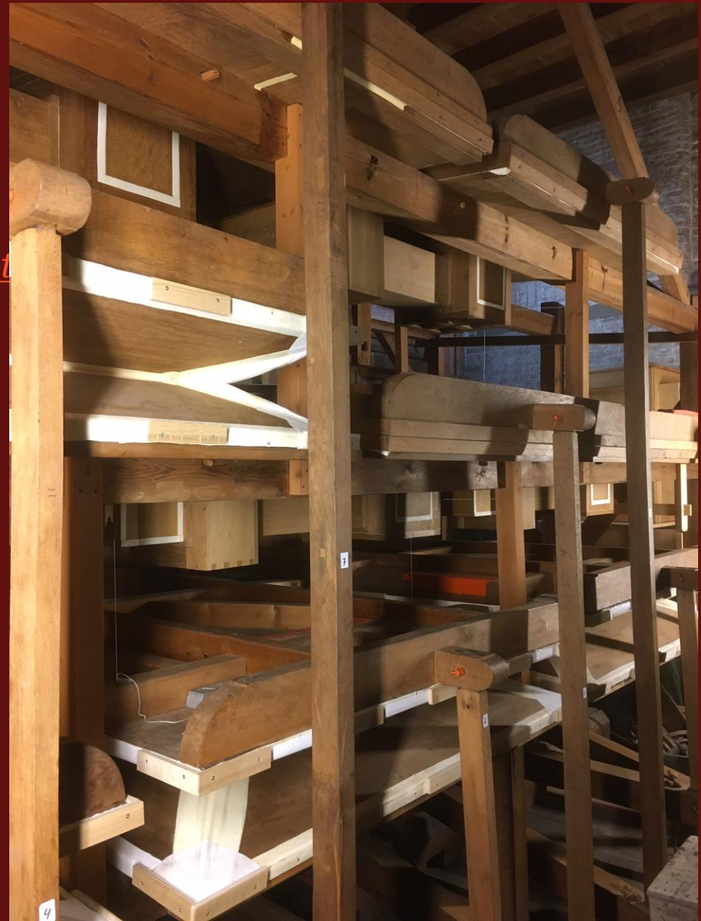
De 8 balgen