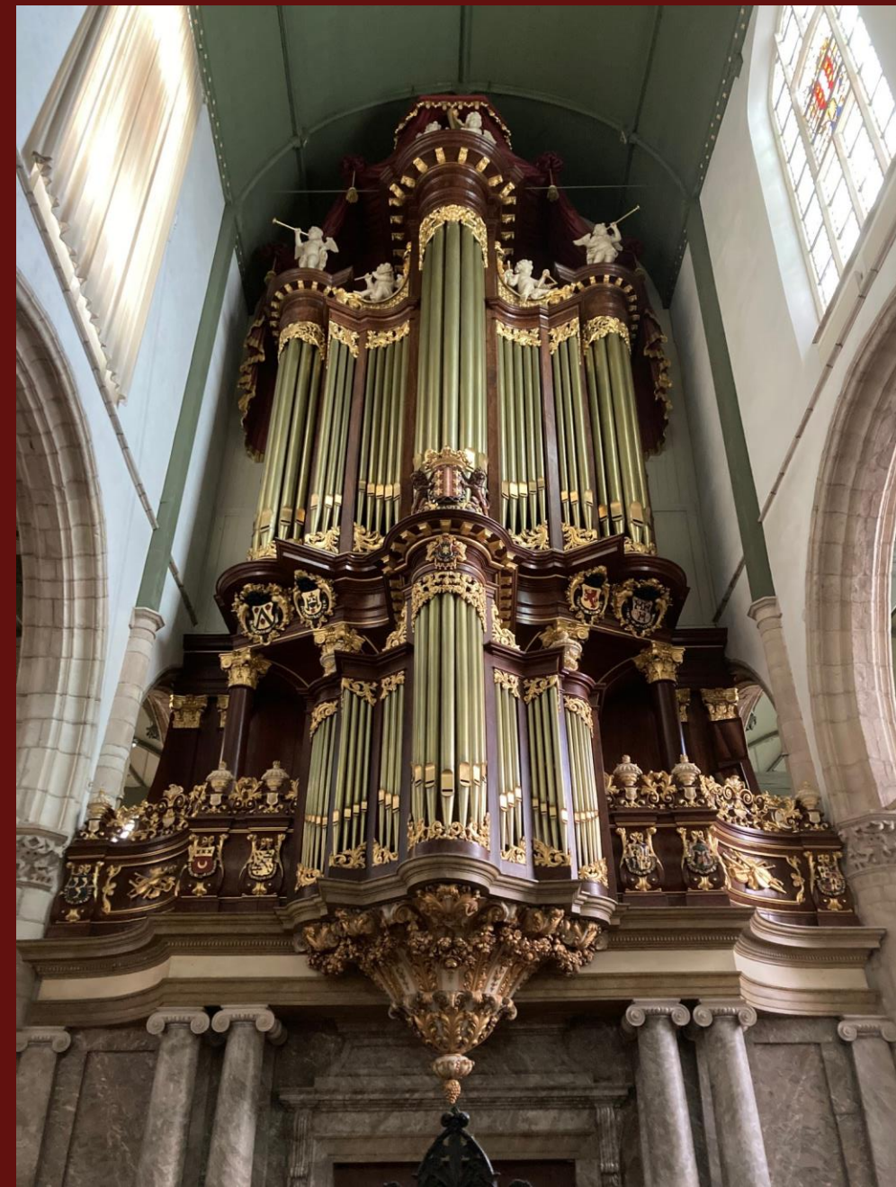
Het historische hoofdorgel (1736)

De betalingsgegevens komen in de bevestigingsmail